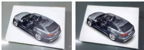
Day Ansicht bei Tag